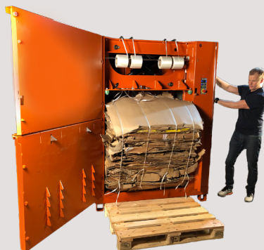
Simplemente presione dos botones para expulsión de balas