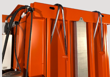
Tubos para un fácil flejado de la bala

Este modelo cuenta con un cilindro cruzado y ofrece un diseño de máquina extremadamente compacto con una altura de transporte e instalación de tan solo 2.000 mm. Su baja altura simplifica el transporte hasta el lugar de instalación y permite gran variedad de opciones de ubicación.