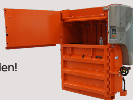
Pendeltür für extra niedrige Bauhöhe.