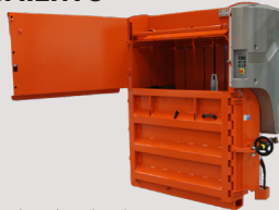
Compuerta regular para una altura de instalación ultrabaja.