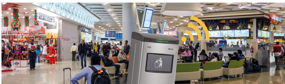
TOM CONNECT Servicio de comunicación m2m