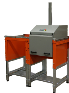
La unidad con varias cámaras tiene una plataforma con dos asas