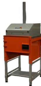
La unidad con cámara única tiene puerta abatible

El compactador se puede ampliar fácilmente con más cámaras adicionales. La puerta delantera de la unidad de cámara única se sustituye por una plataforma para el movimiento sin esfuerzo del cabezal de compresión de una cámara a la siguiente.