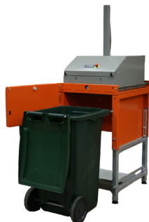
Diseñado para contenedores estándar de 240 L del mercado.

¡El modelo 4240 es más fácil de usar! La versión con varias cámaras es una instalación cómoda de carga superior y la versión de cámara única funciona con la fácil operación de empujar y sacar el contenedor. La seguridad y la calidad son nuestras señas de identidad y el compactador ofrece la máxima seguridad personal tanto para el operador como para las personas que se encuentren en las inmediaciones. Un indicador de contenedor garantiza que la máquina solo se pueda poner en marcha cuando el contenedor esté en la posición correcta.