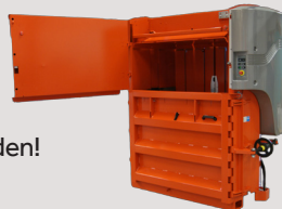
Pendeltür für extra niedrige Bauhöhe.